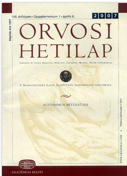
4. ábra. Az Akadémiai Kiadó gondozásában megjelenő Orvosi Hetilap címlapja 2007-ben

mindig szabadságában áll szellemi termékeivel valamely idegen nemzet irodalmában fellépni, mi reá nézve talán előnyös, mert nagyobb számú közönséghez szól, ámde ilyenkor ezen irodalom munkásává válik, s bár nevezetes szerepkört vívhat ki magának, de hazája művelődésére befolyás nélkül marad.”