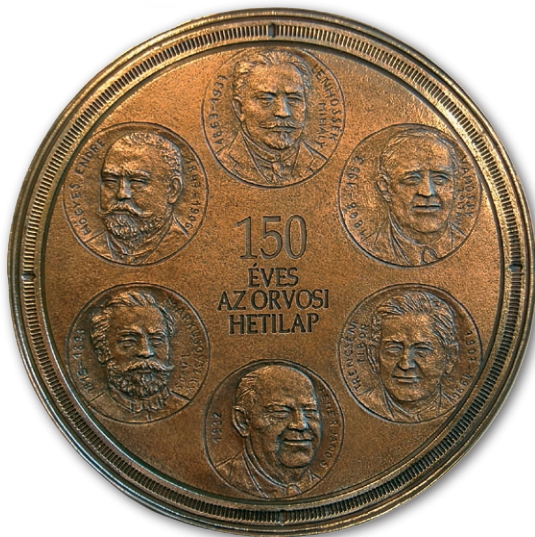
3. ábra. Emlékérem az Orvosi Hetilap 150 éves évfordulójára. Pató Róza alkotása (2007)